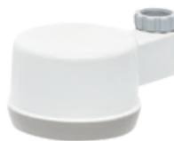
Starterset legionella kraanfilter