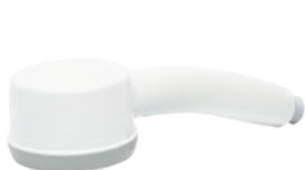
Starterset legionella douchekop