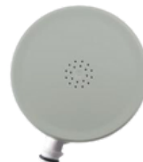
Vervangend filter kraanfilter

Diverse RVS adapters voor montage van het legionella kraanfilter op bestaande tapkranen voor diverse merken