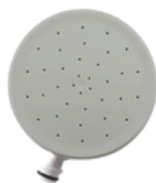
Vervangend filter douchekop