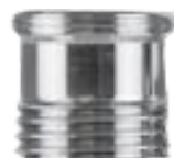
Uitwendig 1/2" naar 22 mm